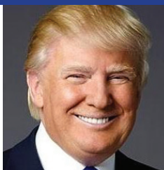
Donald Trump (R)