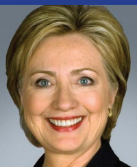
Hillary Clinton (D)