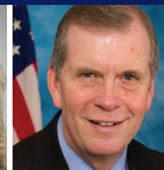
Tim Walberg (R)