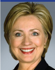
Hillary Clinton (D)