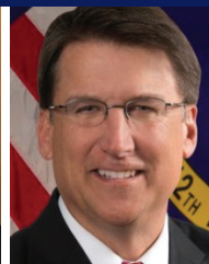
Patrick McCrory (R)