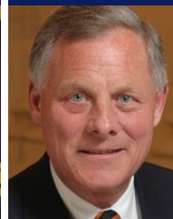
Richard Burr (R)