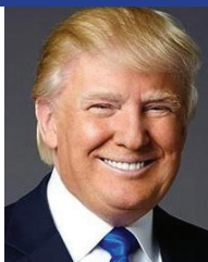
Donald Trump (R)